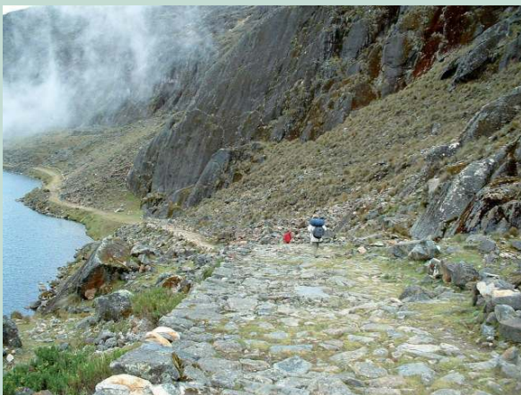
El camino preincaico Takesi es un ejemplo de infraestructura resiliente

Asimismo, es necesario que los planes de desarrollo municipal (PDMs) incorporen el cambio climático de manera transversal en los diferentes sectores de sus actividades y no únicamente en lo relacionado al manejo de riesgos y desastres naturales, como hasta ahora lo han hecho los pocos municipios que consideran el cambio climático.