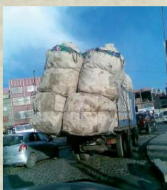
Reciclar y ahorrar recursos es muy importante para combatir el calentamiento global.

Por otra parte, es necesario diseñar y promover prototipos de casas bioclimáticas, que en las zonas altas cuenten con aislamiento térmico y conserven la energía solar pasiva. Mientras que en las zonas cálidas sean lo suficientemente ventiladas para que no se concentre el calor. Estas medidas, además de mejorar la calidad de vida de las personas que habitan estas viviendas, disminuyen el gasto en energía en consecuencia las emisiones de los gases que calientan la atmósfera.