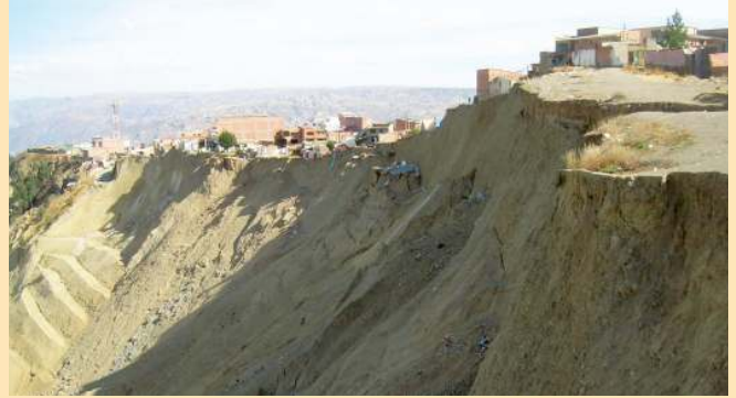
Megadeslizamiento de varios barrios en la ciudad de La Paz, 2011

El año 2006, el Informe Stern ya advertía que si no invertimos en la lucha contra el cambio climático, tendremos que sobrellevar mucho mayores costos para reponer las pérdidas económicas y sociales que ocurran debido al cambio climático. Por eso hemos elaborado una serie de propuestas que esperamos contribuyan a que, al menos a nivel municipal, el país realice avances en enfrentar el cambio climático.