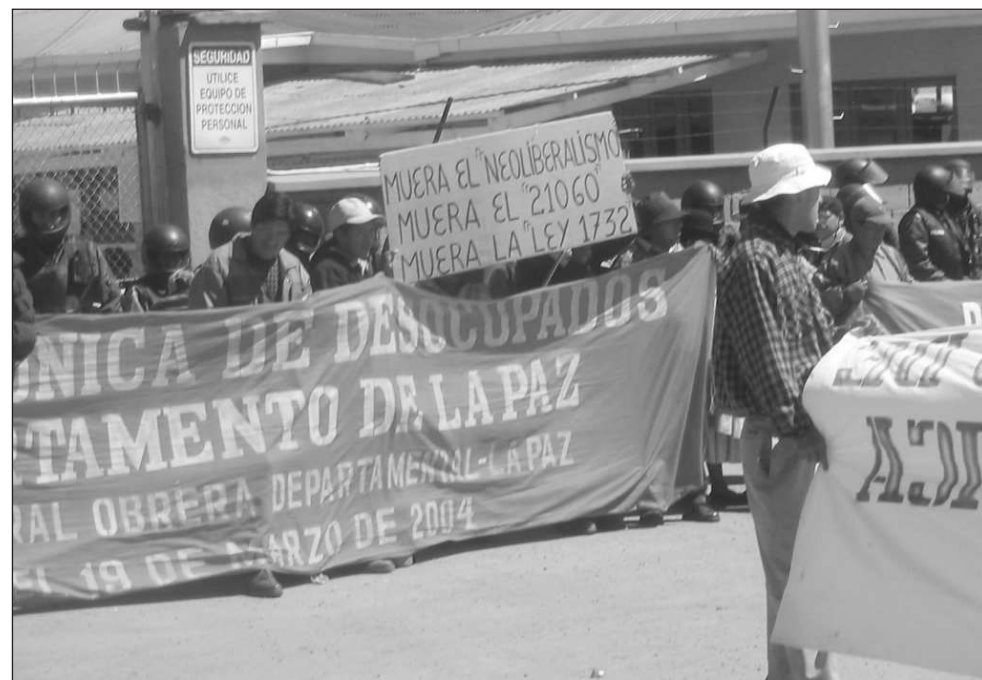
Las organizaciones sociales, como los desocupados, exigieron fuentes de empleo en varias movilizaciones

En el sector minero, el Estado sólo recuperará las concesiones mineras donde no se hayan realizado inversiones.