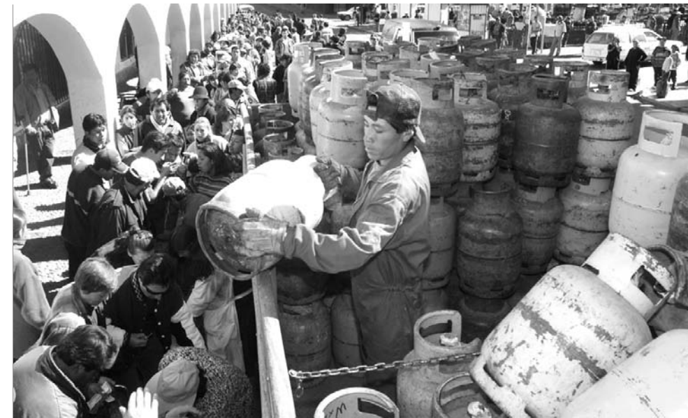
El consumo de hidrocarburos es una preocupación de la población que ya enfrentó periodos de escasez

El grueso de la inversión pública, el 38,9% del total programado, será para infraestructura, las prefecturas y gobiernos municipales 10 ; en otras palabras, no será reinvertido en proceso industrializador alguno. 15,6% de la inversión pública servirá para fomentar la producción de los segmentos inferiores de la matriz productiva, básicamente la pequeña producción. Si el grueso del excedente detentado por el Estado servirá básicamente para programas municipales, infraestructura, gastos corrientes en salud y educación, y fomento a la pequeña producción; mientras que apenas poco más de una décima parte se reinvertirá en la industrialización del sector primario, se puede decir que un proceso de industrialización de los recursos naturales será inviable, sobre todo considerando la elevadísima capacidad tecnológica requerida para la explotación de