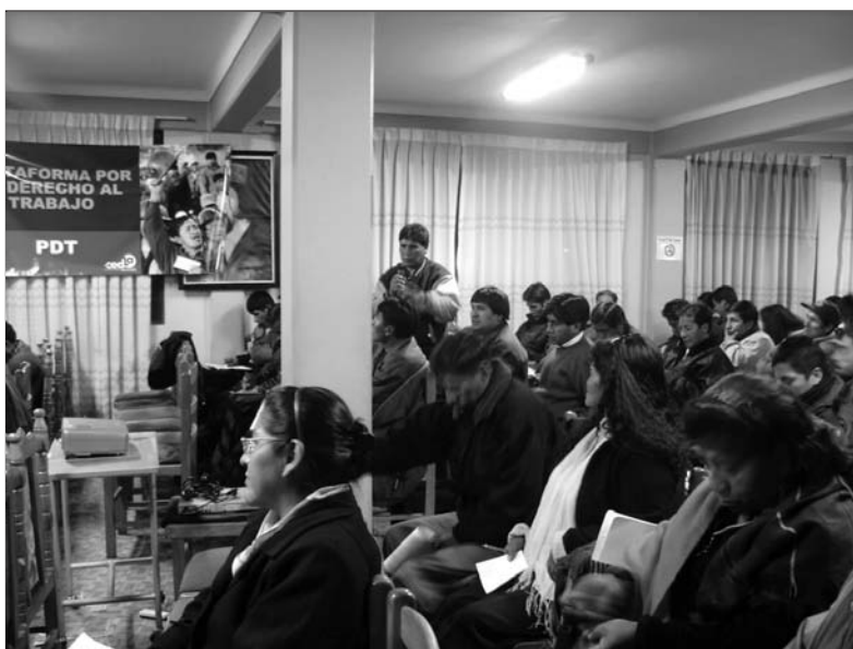
Los asistentes de la PDT debatieron acerca de la importancia de la activa participación de los trabajadores en sindicatos para defender sus derechos.