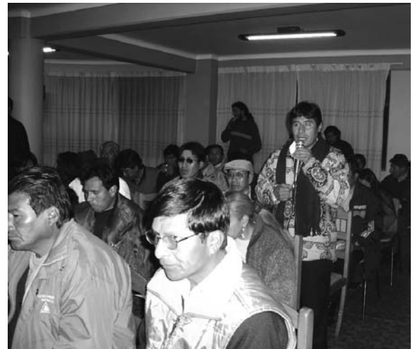
La segunda reunión de la Plataforma por el Derecho al Trabajo se realizó en la Federación de Trabajadores Fabriles de La Paz

A partir de los testimonios de los ex trabajadores del TEA expresados en el foro —quienes criticaron la actitud pasiva y poco solidaria de los dirigentes departamentales y nacionales en el conflicto—, varios de los participantes de la PDT ratificaron la