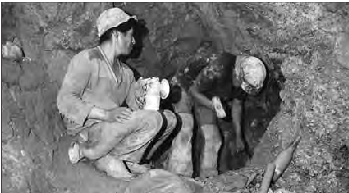
En el sistema de minería manual, los trabajadores no cuentan con herramientas adecuadas

La minería no articula el desarrollo integral del país, ni de las regiones mineras, debido a que no establece las condiciones básicas para el desarrollo industrial