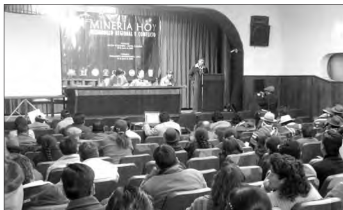
Más de 200 personas participaron del foro debate sobre minería en Oruro.

Asimismo, la pobreza hace de la política de “responsabilidad social” de la empresa un mecanismo de legitimación a partir de mínimos gastos sociales que al