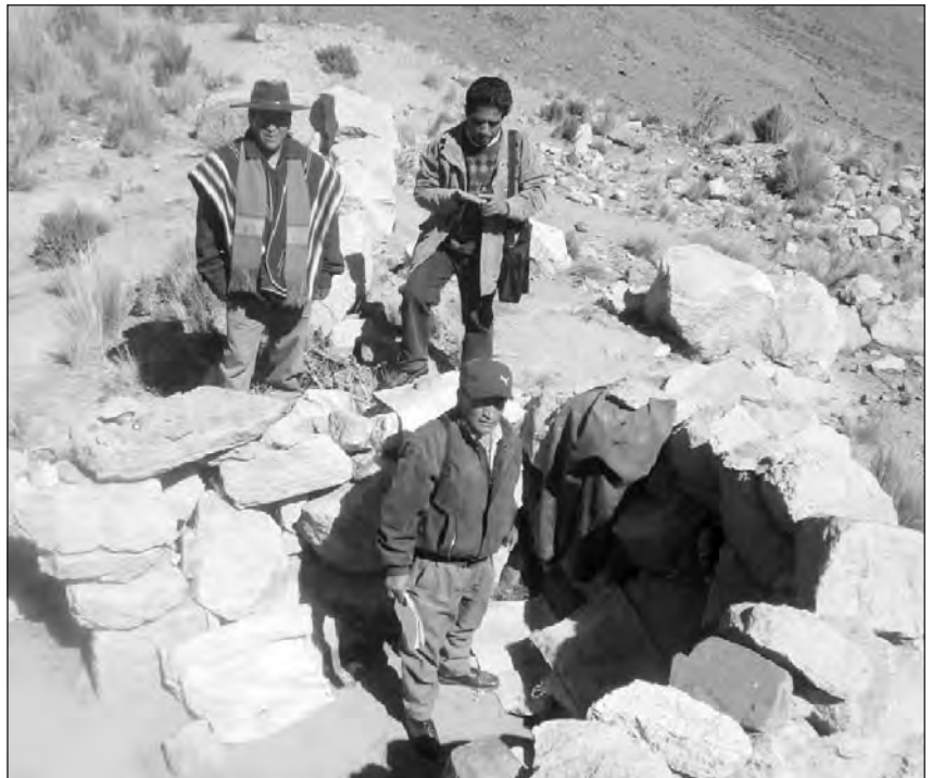
Pobladores de la región de Poopó evalúan las condiciones de agua potable en la región.

la minería mediana están en manos de los extranjeros.