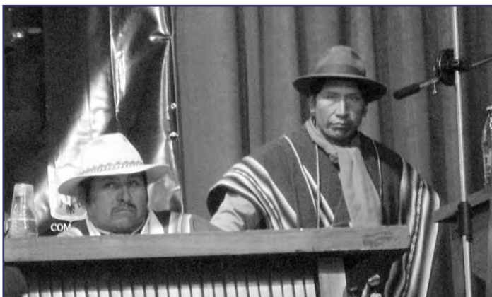
Autoridades originarias de la región de Poopó abrieron un frente de debate para revelar y denunciar su situación..