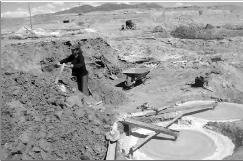
El impacto de la actividad minera se ve claramente reflejada en amplias extensiones de territorio en Poopó.

Oruro es minería y la prefectura pide unidad, que no exista esa pugna entre el sindicalismo y el cooperativismo