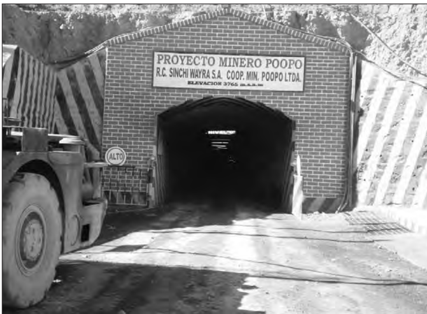
Bocamina del Proyecto Minero Poopó a cargo de la empresa Sinchi Wayra S.A.