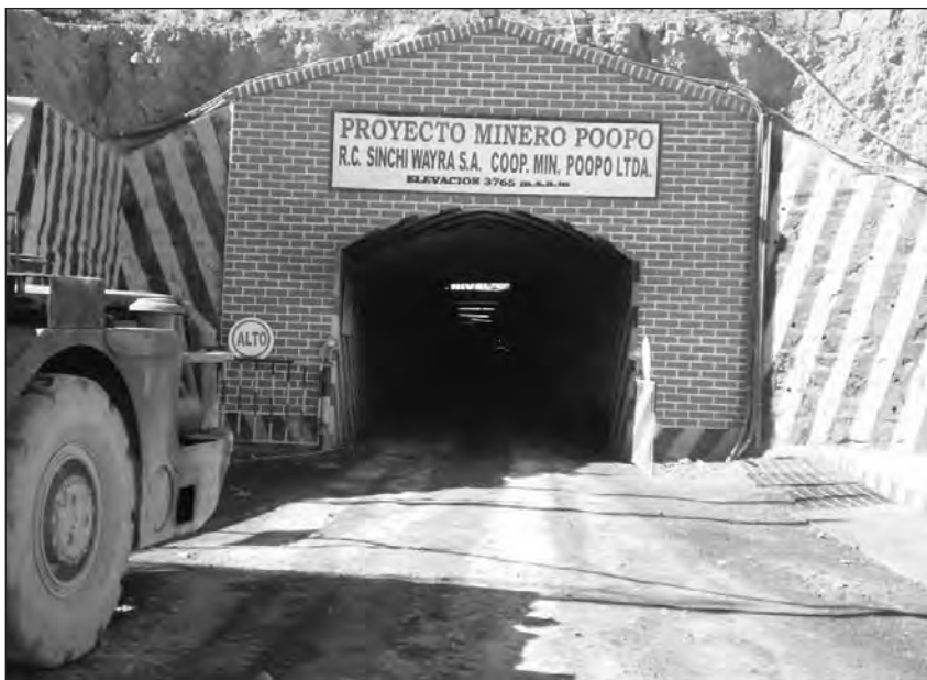
Bocamina del Proyecto Minero Poopó a cargo de la empresa Sinchi Wayra S.A.