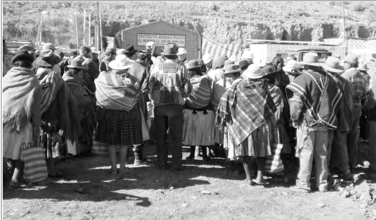
Pobladores de las distintas comunidades de la región de Poopó reunidos frente a la mina de la empresa Sinchi Wayra.

Desde el año 2005, Glencore Internacional AG, a través de su subsidiaria la Empresa Minera Sinchi Wayra S.A. opera el Proyecto Minero Poopó