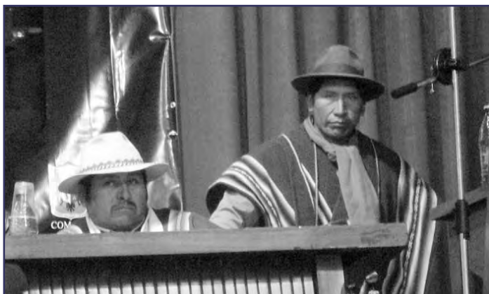
Autoridades originarias de la región de Poopó abrieron un frente de debate para revelar y denunciar su situación..