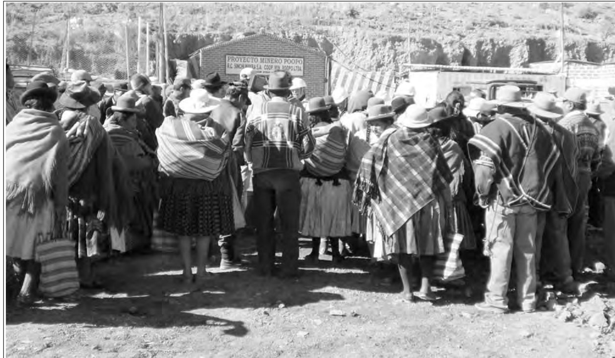
Pobladores de las distintas comunidades de la región de Poopó reunidos frente a la mina de la empresa Sinchi Wayra.

Desde el año 2005, Glencore Internacional AG, a través de su subsidiaria la Empresa Minera Sinchi Wayra S.A. opera el Proyecto Minero Poopó